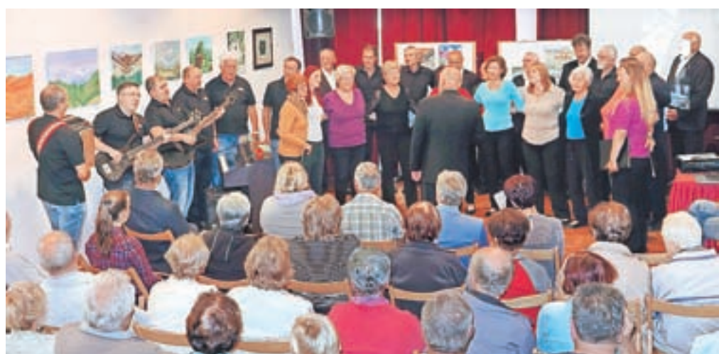
Sklepna prireditev Langusovih dni je vključevala tudi druženje pevskih zborov.