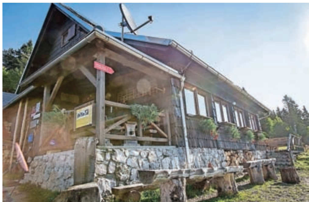
Roblekov dom, najbolj priljubljena planinska kočica leta 2017

Do sredine septembra je bila kočica odprta vsak dan, zdaj pa planince sprejemajo ob koncih tedna. To nedeljo, 24. septembra, bo na Robleku ob 11. uri praznovanje ob zaključku izbora za naj planinsko kočico 2017 s krajšim kulturno-zabavnim programom, predajo plaket zmagovalcem letošnje akcije, animacijami za mlado in staro ter delavnicami za otroke, so še sporočili s PZS.