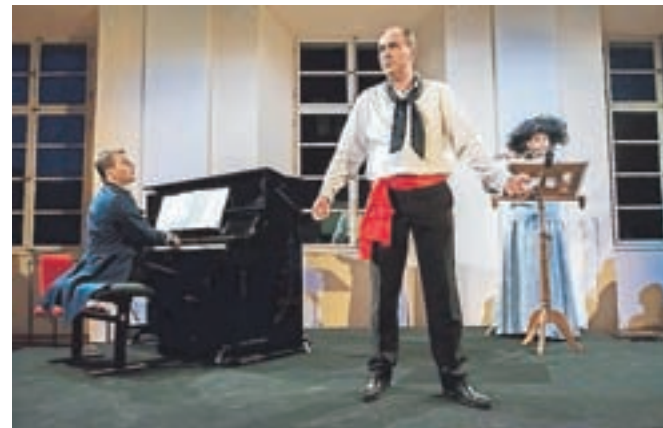
Čarobne neapeljske melodije, polne strasti in melanholije

Občinstvo, ki je konec avgusta do zadnjega kottička napolnilo Baročno dvorano Radovljiške graščine, je uživalo v čarobnem koncertu neapeljskih melodij.