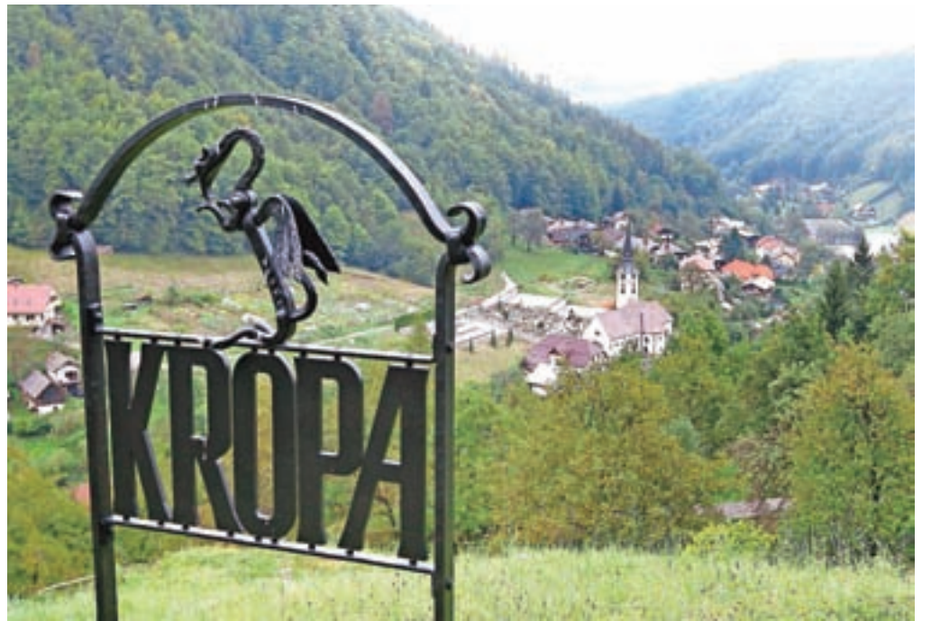
Letos mineva deset let, kar so Kropa prizadele hude poplave.

Načrti za sanacijo neposredne škode po poplavih so bili v Kropi uresničeni v treh letih po ujmi, desetletje po tem, ko se je hudournik Kroparica silovito razlil po vasi in za seboj pustil opustošenje, pojasnjujejo na Občini Radovljica. »Obnovljena je bila državna cesta, sanirano vodno zajetje, del vodovodnega in kanalizacijskega omrežja, Gosposka ulica na levem bregu Kroparice, na novo urejen Plac, obnovljene zgornje fužine, nadomeščen Koruzni most, saniran kulturni spomenik Bodlajev vigenjc, urejena okolica vigenjca Vice in protipoplavno zaščiten Slovenska peč. Na celotnem odseku Kroparice in delu potoka Lipnica so bili izvedeni vodnogospodarski posegi. Ministrstvo za kulturo je vodilo obnovo fasad več stanovanjskih objektov.« Za sanacijo so namenili 1,5 milijona