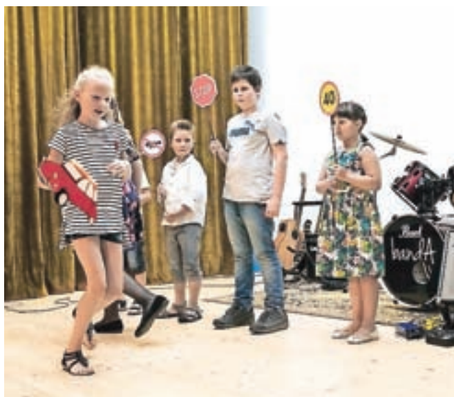
Na prireditvi so nastopili učenci Podružnične šole Ljubno.