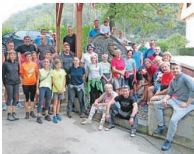
Tekači in pohodniki na cilju poti, v Langusovi rodni Kamni Gorici

V petek, 1. septembra, so v Radovljici, v Predtrgu, pripravili že deveto srečanje prebivalcev Langusove ulice, imenovano Langusova gibanica. Tudi tokrat so se tekači in pohodniki odpravili čez Fuxovo brv do Kamne Gorice, zvečer pa pripravili piknik in tako nadaljevali tradicijo vsakoletnega veselega druženja stanovalcev, ki živijo v isti soseski. Kljub temu, da jim vreme letos ni bilo najbolj naklonjeno, so dan in nato večere preživeli v veselem športno - zabavnem vzdušju.