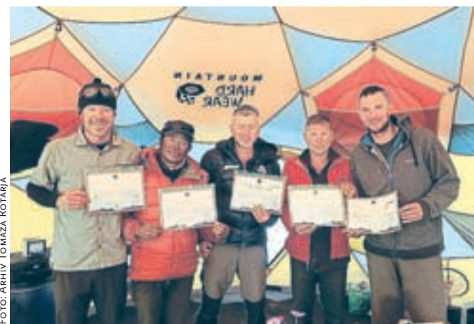
Priznanje za osvojitev Everesta, najvišjega vrha sveta

"Višinske bolezni ni imel nihče od nas, a višino čutiš. Vsi iz naše skupine, razen enega, ki je obupal na taboru 2, smo prišli na vrh. Nad višino osem tisoč metrov je sicer težko govoriti, da nimaš višinske bolezni. Tam se samo govori, ali imaš pljučni ali možganski edem."