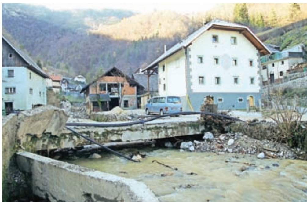
Sanacija Kroke po vodni ujmi je bila končana v treh letih po poplavih, sledila je gradnja komunalne infrastrukture, ki se letos nadaljuje v Kamni Gorici.

"Kljub temu že danes lahko rečem, da smo ponosni na Kropo. Mislim, da je kraj zdaj varen pred poplavi. Je pa res, da je narava nepredvidljiva in da nikole ne moremo vedeti vnaprej, kakšna količina vode bo po strugi prišla v kraj. V zadnjem obdobju smo sicer sanirali tudi precej nabrežin, poskrbeli za redno čiščenje vodotoka tako da menim, da se katastrofa, kakršni smo bili priča leta 2007, ne bi smela ponoviti."