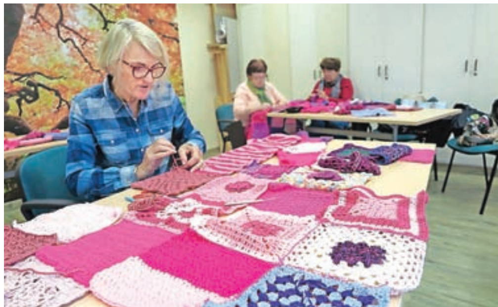
Takole so v prostorih Ljudske univerze Radovljica pletli rožnate kvadrate za šale, s katerimi bodo v ponedeljek, 2. oktobra, ovili drevesa v grajskem parku.

ske, številne upokojenke Medgeneracijskega centra in tudi zaposleni ter celo mladi iz Mladinskega centra Kamra. Z nakvačkanimi in pletenimi rožnatimi pleteninami bodo drevesa v radovljiškem drevoredu ovili v ponedeljek, 2. oktobra, ko bo ob 16. uri tudi osrednja prireditev ob dogodku. Dan za tem bodo ob 17. uri s pleteninami ovili tudi drevesa na jezerski promenadi na