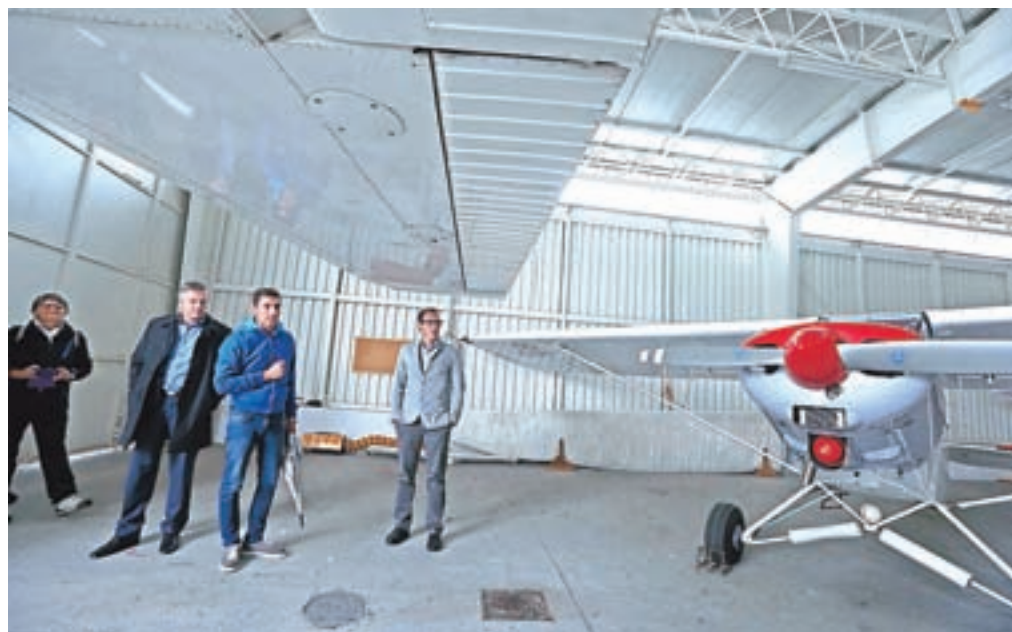
Letošnja novost je bilo tudi postajališče na leškem letališču, kjer so člani ALC Lesce za obiskovalce pripravili vodene ogledne.

Kolar, ki strokovno sodeluje na učnem vrtu, bodo v sklopu dogodka poleg ogleda vrta, za obiskovalce pripravili tudi krajše predavanja o različnih načinih pridelave hrane, kjer bodo pojasnili, zakaj je tako zelo pomembno, da vemo, kaj jemo. Na vrtu bo tisti dan potekalo tudi zbiranje starih sort semen fižola in graha, zato organizatorji prosijo obiskovalce, da s seboj prinesejo semena in tako pripomorejo k ohranjanju naše dediščine.