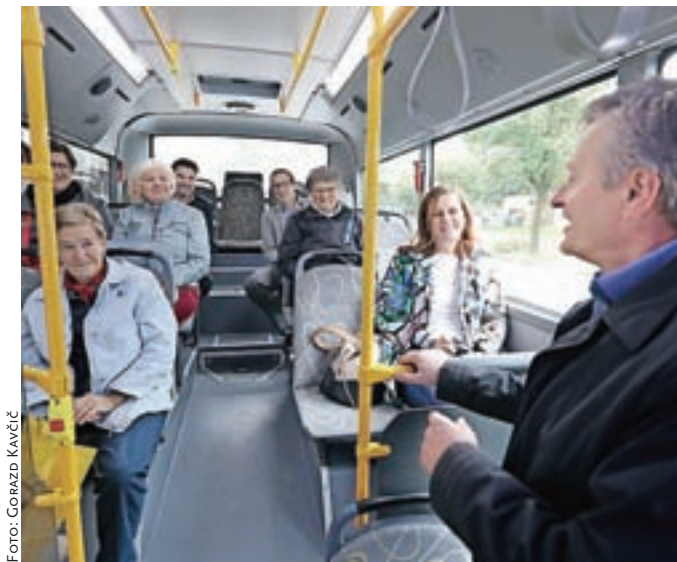
V Radovljici in Lescah je v okviru Evropskega tedna mobilnosti tudi letos vozil brezplačni mestni avtobus.

Potniki so se tudi letos razveselili brezplačnega avtobusa, predvsem starejši. "Že lani sva se peljala z brezplačnim mestnim avtobusom. Danes se samo peljeva, v četrtek pa bova šla z avtobusom še po opravkih," je v torek dopoldne povedala ena od potnic. "Za ljudi, ki nimamo avta, bi bila takšna pridobitev res dobrodošla."