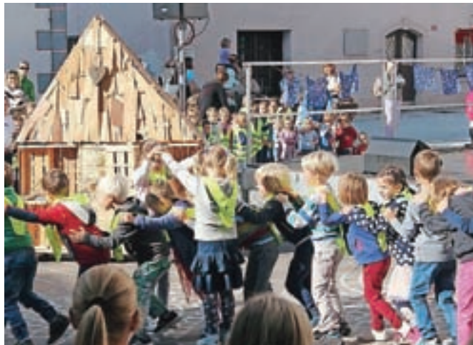
Utrinek z lanske prireditve