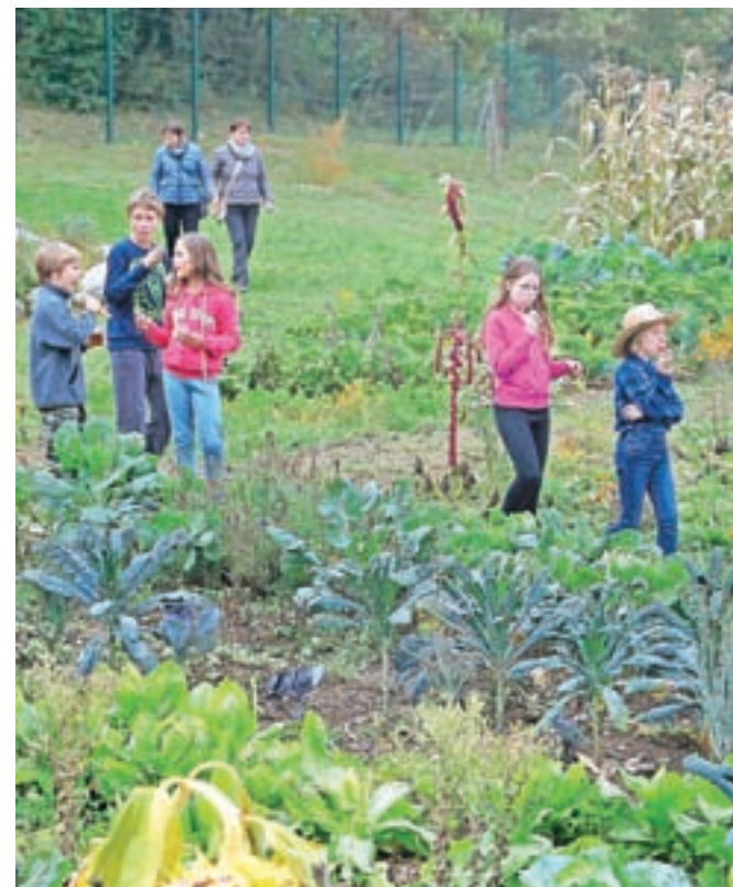
Prireditve ob zaključku sezone so na šolskem vrtu pripravili tudi lani.

Na biodinamičnem učnem vrtu ob radovljiški osnovni šoli bodo tudi letos pripravili zaključno prireditev, ki so jo poimenovali kar Eko praznik. Srečanje ob degustacijah in predstavitev se bo v četrtek, 5. oktobra, začelo ob 15.30.