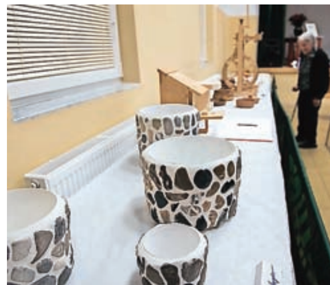
V domu športnega društva je bila ob prazniku na ogled razstava izdelkov domačinov.